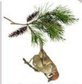
и свалился во сне.