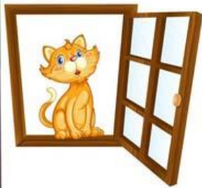
Кошка в окошке