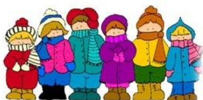
Дети оделись тепло, и пошли гулять.