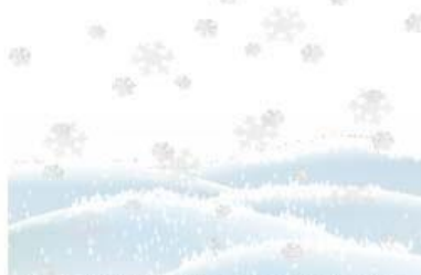
Всюду белый, пушистый снег.