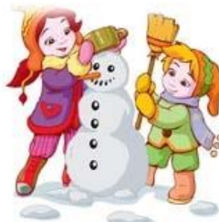
слепили веселого снеговика.