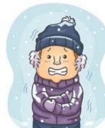
Холодно на улице.