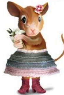
а мышка в сапожках