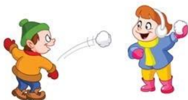
поиграли в снежки, www.promany.ru