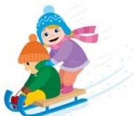
Они покатались на санках,