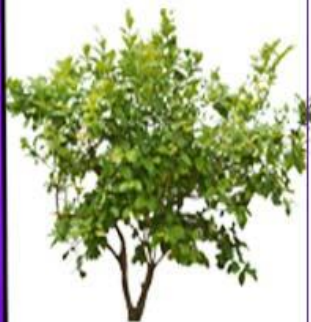
У высокого куста